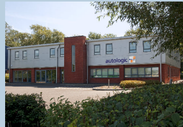
Hauptsitz von Autologic in Wheatley bei Oxford